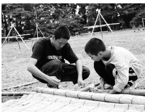
【小学生の参加者に指導する高校生ボランティア】